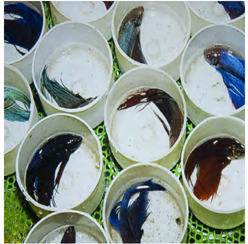
bilder fra Fossås foredrag; slik drettes og transporteres kampfisk (Betta splendens) kommersielt. Uvant, for å si det mildt.